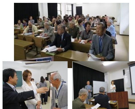
26年度の年次総会の様子