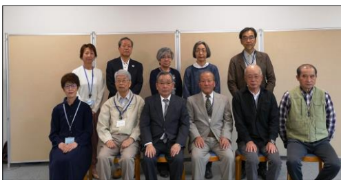
= 新年度役員の皆様 =